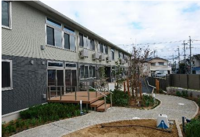
ウッドデッキ・遊歩道・菜園