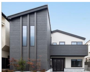
『グループホームきらら新高円寺』

またスタートグループでは、京都市中央卸売市場第一市場「賑わいゾーン」活用事業（※）の開発に携わるなど、地域の皆さまに、幅広いサービスの提供を目指しています。※京都の「食」と「職」をテーマとした商業施設とホテルを組み合わせた2020年開業予定の複合施設