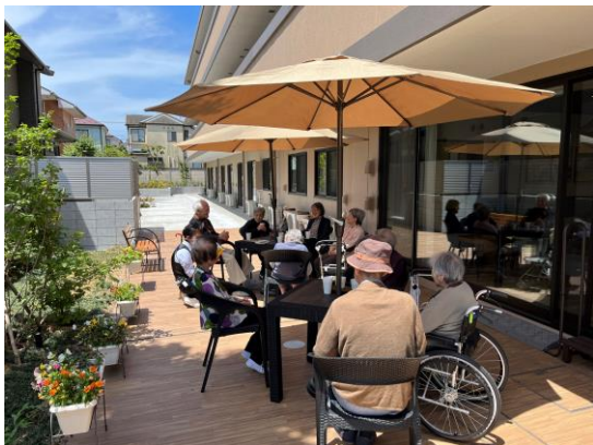
うららカフェの様子

施設一階にあるガーデンテラスを利用した「うららカフェ」を週1～2回実施。香り高いドリップコーヒーや紅茶、おやつを提供し、緑に囲まれた開放的な空間でお仲間との交流を楽しんでいただいています。談笑だけでなく、歌唱やクイズなどの脳トレ、レコード鑑賞などそれぞれの方の興味に合わせて日ごろとは違う時間を楽しんでいただいています。毎回20名程度のご入居者が参加し、テラスは大変な賑わいとなっています。