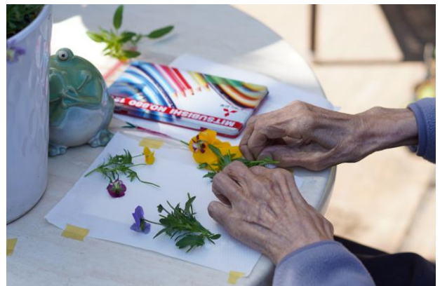
めばえの園芸の様子 テラスで摘んだピオラを押し花へ

「今後は“認知症カフェ“につなげ、地域やボランティアの方にもご参加いただける、交流できる場にしていきたい。」と地域に開かれたカフェに発展させていけるように、ボランティアの募集や受け入れ方法の仕組みづくりなど参加スタッフの増員を進めています。